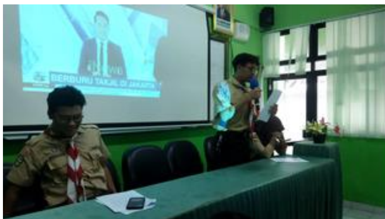
Gambar 3. Kegiatan siswa praktik membaca berita TV