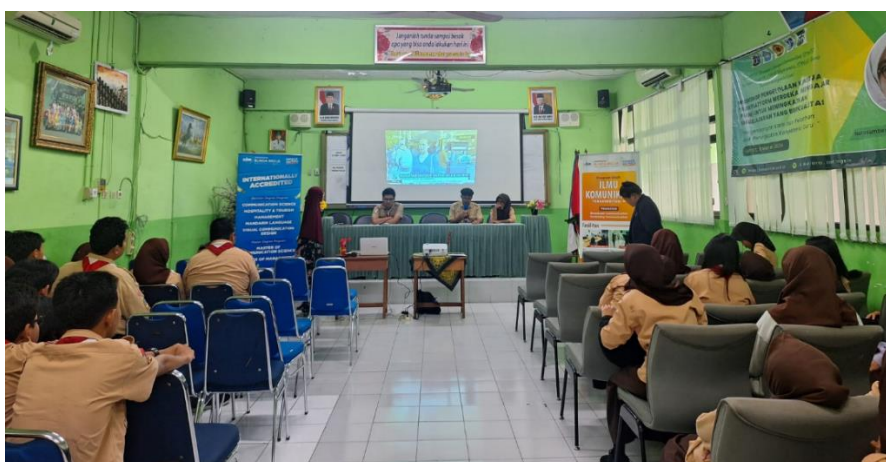
Gambar 4. Kegiatan pemateri sedang menyampaikan materinya