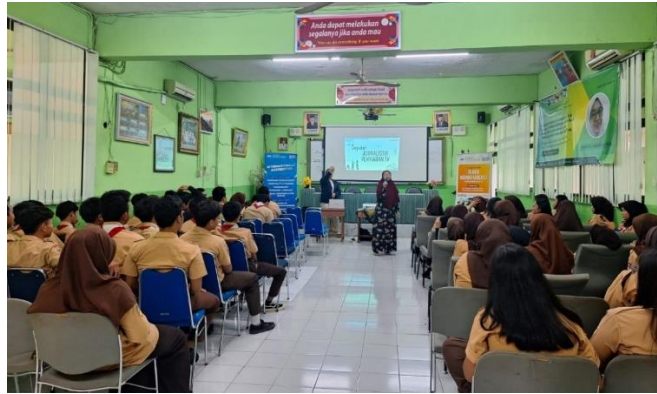
Gambar 2. Kegiatan pemateri sedang menyampaikan materinya