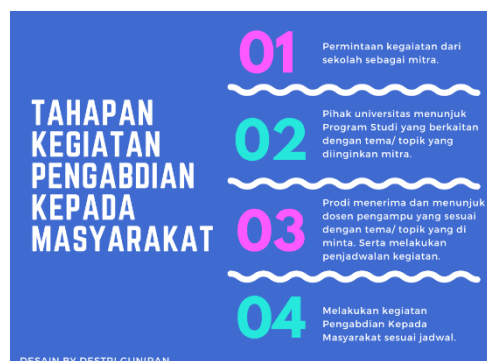
Gambar 1. Alur Kegiatan Pelaksanaan PKM

Berikut alur mulainya kegiatan secara umum yang dilakukan.